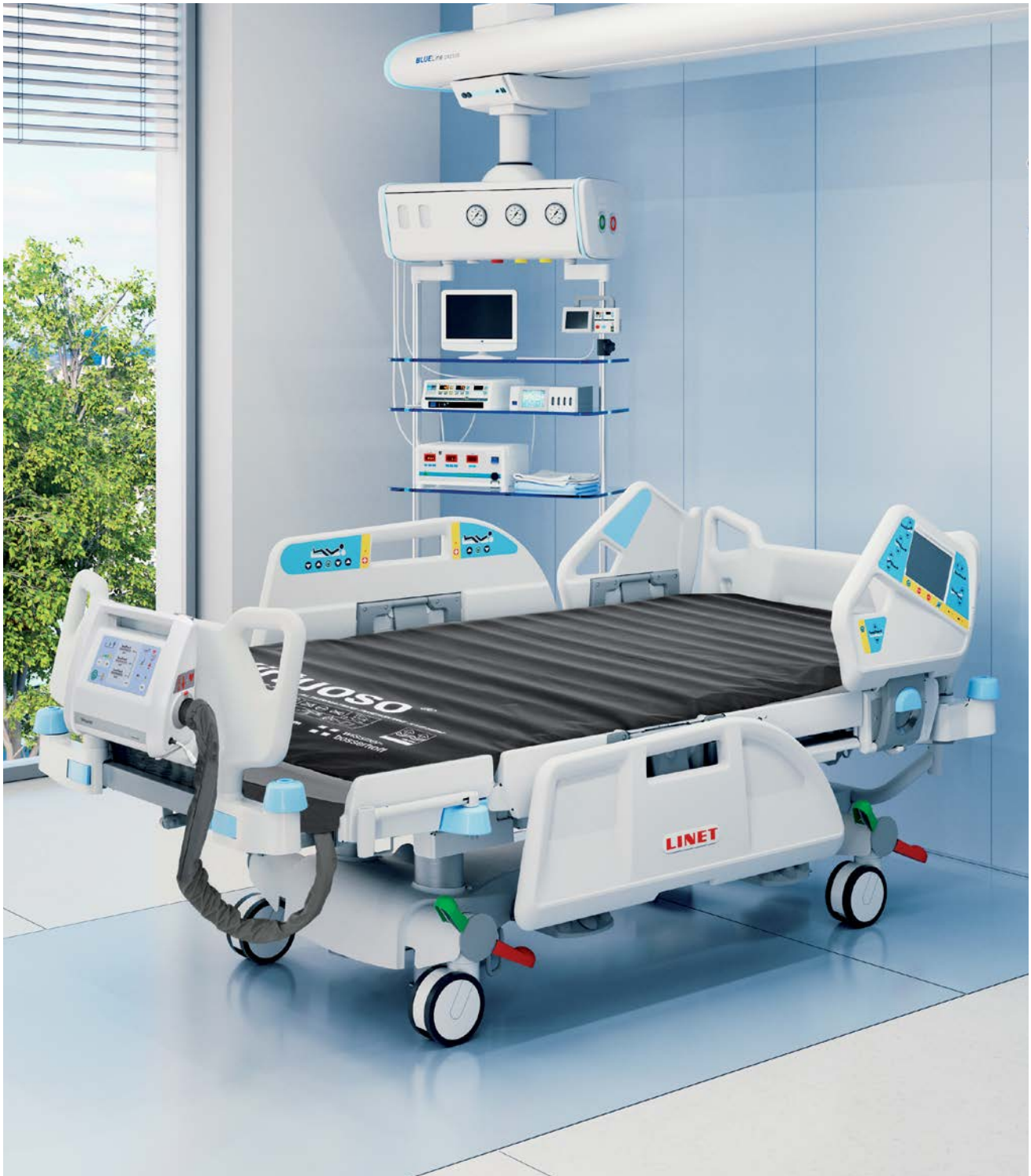
Pat pentru Terapie Intensivă