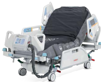
Virtuos cu presiune zero și tehnologie cu 3 celule

Arhitectura deschisă a patului MULTICARE permite utilizarea diferitelor sisteme de saltele pentru prevenirea sau vindecarea escarelor de decubit, în funcție de nevoile pacientului.