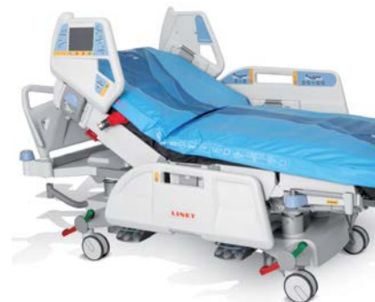
OptiCare cu design integrat