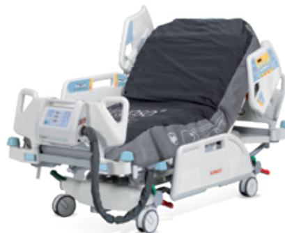
Virtuoso cu presiune zero și tehnologie cu 3 celule

Arhitectura deschisă a patului Multicare LE permite utilizarea diferitelor sisteme de saltele pentru prevenirea sau vindecarea escarelor de decubit, în funcție de nevoile pacientului.