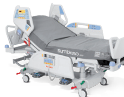
Symbioso cu design integrat